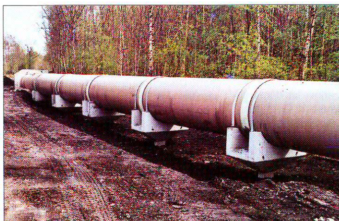
Bild 1: Auf Stützen verlegter Doppelrohrkanal Fig. 1: Twin-pipe conduit installed on supports

Die Maßnahme wurde in zwei Bauabschnitte aufgeteilt. Der I. Bauabschnitt führte von der Kläranlage Essen-Burgaltendorf entlang eines ehemaligen Bahndammes über etwa 800 m in Richtung Regenrückhaltebecken Holteyer Straße. Eine Besonderheit der Planung und Ausführung in diesem Bereich war der teilweise oberirdische Verlauf des Kanals ( Bild 1 ).