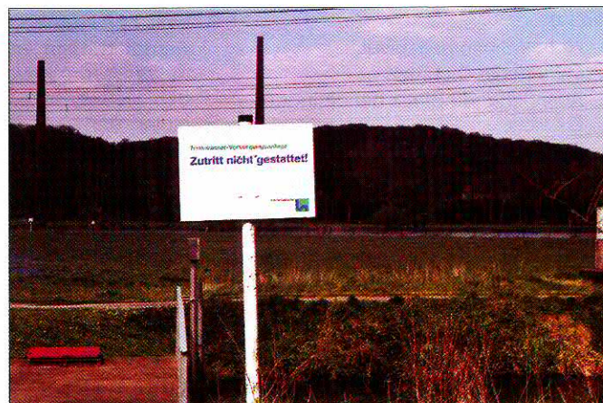
Bild 2: Trinkwasserschutzzone Fig. 2: Protected drinking-water catchment area